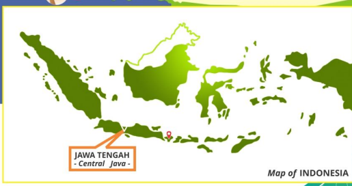
Map of INDONESIA