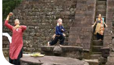
Srawung Seni Candi

Perhelatan seni di situs cagar budaya sebagai sarana menyatukan keinginan para pujangga dan pencinta seni untuk mengeksplorasi dan mengekspresikan nilai budaya dan tradisi dengan kolaborasi modern.