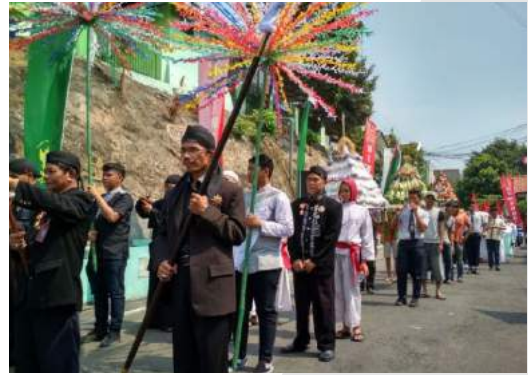
Haul Makam Sunan Pandanaran