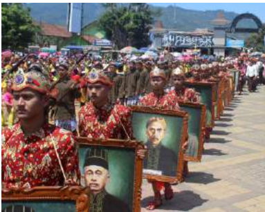
Hari Jadi Kabupaten Banjarnegara

Baritan adalah tradisi selamat rojo koyo sebagai wujud rasa syukur masyarakat Desa kepada Tuhan yang Maha Esa atas limpahan rezeki melalui ternak mereka. Harapannya hewan ternak mereka menjadi sehat dan dapat berkembang biak dengan baik sehingga mendatangkan rezeki bagi pemiliknya. Narahubung : 0812 2921.1359