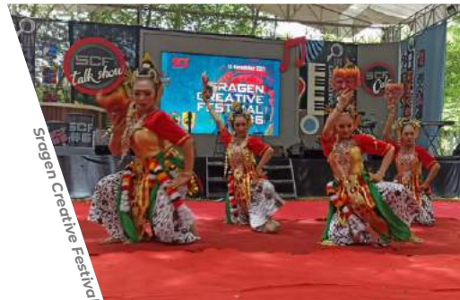
Sragen Creative Festival