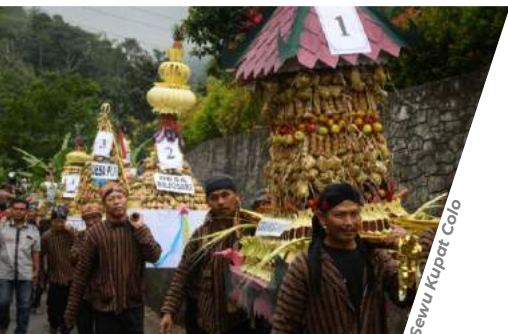
Sewu Kupat Colo