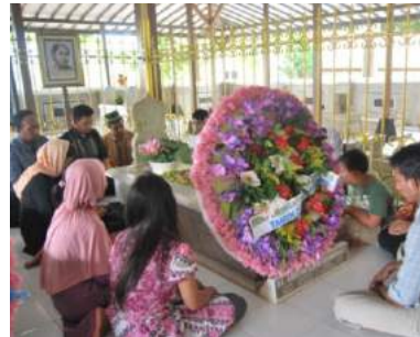
Ziarah Makam RA Kartini

Kirab budaya tumpeng sewu adalah kirab budaya tahunan yang diselenggarakan masyarakat desa Plesungan, kecamatan Gondangrejo, kabupaten Karanganyar sebagai ungkapan rasa syukur kepada Tuhan Yang Maha Esa.