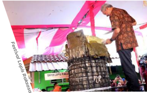
Festival Lopis Raksasa

Peringatan Hari Jadi Kabupaten Sragen ke-276 yang dimeriahkan dengan pentas kesenian daerah.