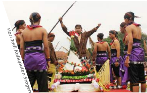
Hari Jadi Kabupaten Sragen