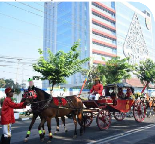
Kirab Budaya Hari Jadi Kabupaten Sukoharjo