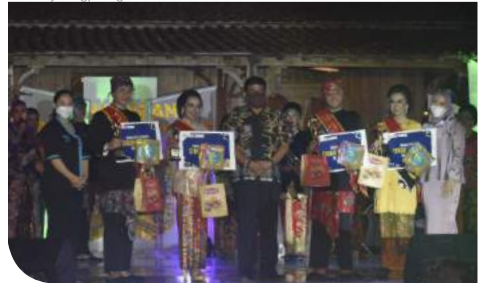
Pemilihan Sinok Sinang