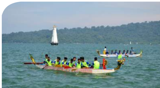
Festival Perahu Naga