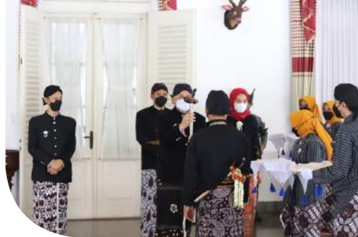
Jamban Tosan Aji

Event tahunan yang diselenggarakan setiap bulan Agustus dengan menampilkan seni pertunjukan seperti gejug lesung, pementasan drama teater, dll.