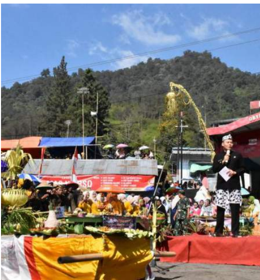
Ruwat Bumi Guci