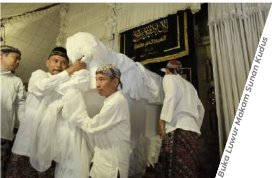
Buka Luwur Makam Sunan Kudus