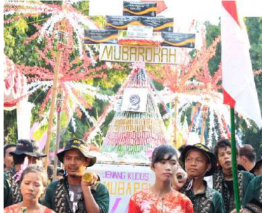
Kirab Jenang Tebokan

Tradisi tahunan masyarakat Desa Rembul dan Desa Pekandangan di lokasi Obyek Wisata Guci tiap 1 Suro sebagai bentuk ungkapan syukur atas kemakmuran yang diberikan oleh Tuhan Yang Maha Esa dan juga memohon keselamatan. Acara diawali arak-arakan Gunung hasil bumi, memandikan Kambing Kendit, pembacaan riwayat Guci dengan Bahasa Tegal, dan terakhir rebutan gunung.