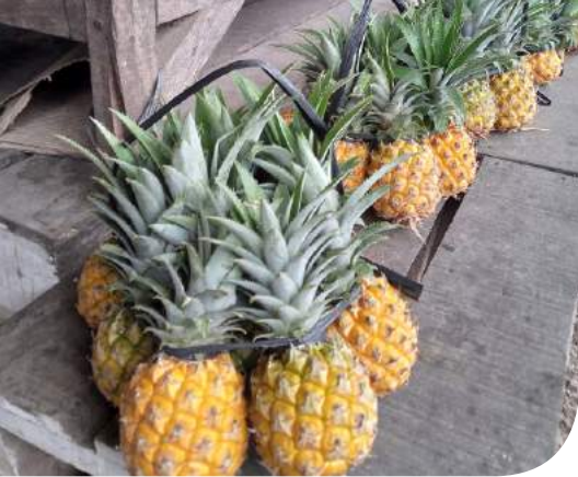
Festival Nanas Madu