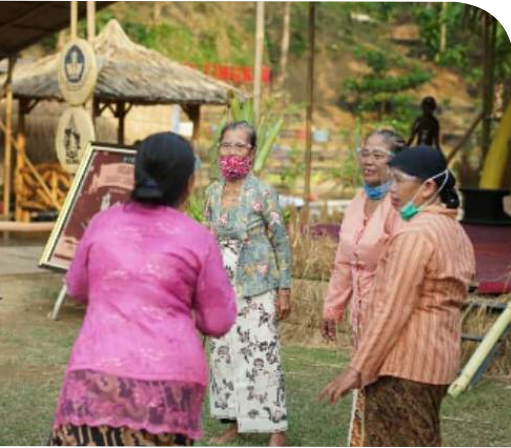
Pagelaran Seni Sangir