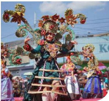
Klaten Lurik Carnival