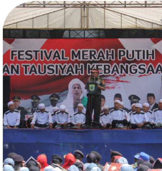
Festival Merah Putih

Festival Merah Putih bertujuan untuk meningkatkan wawasan kebangsaan, rasa cinta tanah air dan mempererat persatuan dan kesatuan bangsa. Acara diisi dengan pembentangan bendera Merah Putih raksasa di Gunung Jimat, upacara penghormatan, doa bersama.