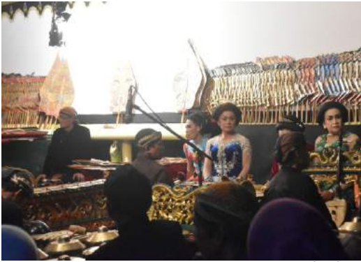
Tutupan Sadran Kalitanjung