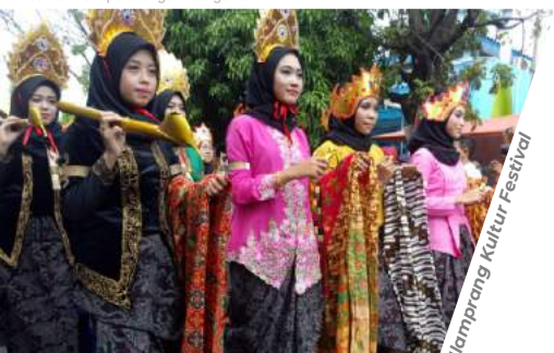
Jlamprang Kultur Festival

Peringatan wafatnya Nyai Sedapu (adik Ki Ageng Pandanaran) yang diisi dengan pengajian, karnaval budaya, pasar malam, dan lomba mirip Nyai Sedapu.