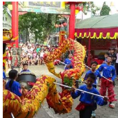
Kirab Tahun Baru Imlek di Pati

Perayaan tahun baru Imlek dimeriahkan dengan kirab barongsai dan Pasar Imlek yang menjual berbagai kerajinan, pakaian dan juga makanan/ jajanan. Narahubung : 0852 9066 8663