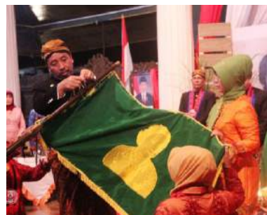
Kirab Pataka RA Kartini