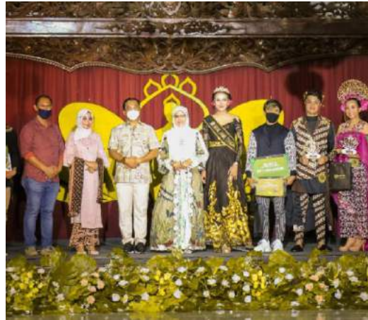
Roban Fashion Week

Kabupaten Wonogiri menjadi tuan rumah kejuaraan downhill atau balap sepeda menuruni bukit ekstrem. Kegiatan digelar di lintasan menantang dengan rute Watu Cenik-lahan bekas camping ground atau bumi perkemahan di Desa Sendang.