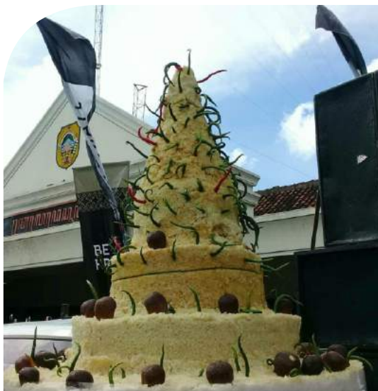
Haul Sunan Prawoto

Kirab Akbar “Gi Ang” atau kirab dewa-dewi yang berpusat di Tempat Ibadah Tri Dharma Klenteng Po An Thian Jalan Belimbing pada hari ke-15 dan hari terakhir dari masa perayaan Tahun Baru Imlek. Acara dimulai siang hari dengan ritual dan atraksi barongsai, marching band , dan arak-arakan dewa-dewi kepercayaan Tionghoa yang ditempatkan dalam Topekong , kemudian diarak mengelilingi Kota Pekalongan.