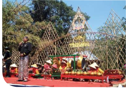
Gelar Budaya Bulakan Sapi Lanang

Suran Gunungwuled diisi dengan kegiatan mulai dari membersihkan makam para leluhur, berkumpul di lapangan untuk mendengarkan wejangan dari ketua adat sambil menikmati sajian taki, pembacaan kidung jagat dalam syair macapat dibawakan oleh sesepuh desa, diakhiri dengan doa bersama.