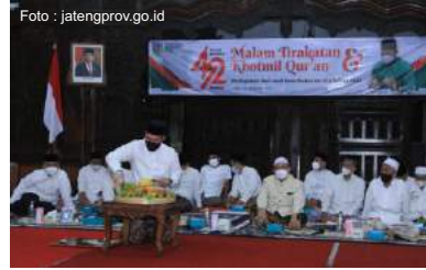
Hari Jadi Kab. Kudus