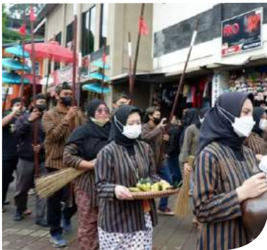
Babad Tanah Dieng Kejajar