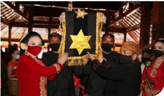
Prosesi Boyong Grobog