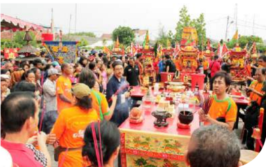
Gotong Toa Pekong

Setiap tanggal 14-15 Cia Gwee, masyarakat keturunan Tionghoa merayakan Cap Go Meh. Satu per satu dewa digotong menggunakan tandu keluar dari klenteng Tek Hay Kiong menuju pelabuhan Tegal untuk sembahyang pantai atau sembahyang kepada dewa Kongco Kwee Lak Kwa. Barongsai dan Liong menjadi syarat pembuka ketika patung dewa akan dikeluarkan untuk diarak.