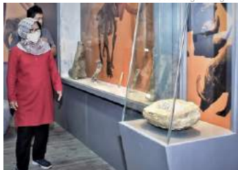
Museum Situs Semedo