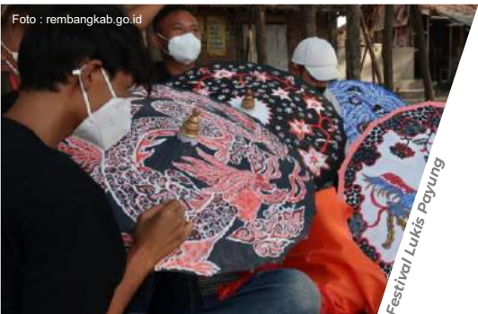
Festival Lukis Payung

Haul Mbah Rogo Moyo merupakan peringatan wafatnya Mbah Rogo Moyo tiap 13 Sura, Prosesi yang dilaksanakan ialah mengganti kain luwur Makam Mbah Rogo Moyo dan beberapa makam keluarga serta kerabat dekat, diiringi kegiatan khataman Al-Qur'an, pengajian umum, tahlil umum, serta pembagian nasi berkah. Peringatan Haul juga dikemas dalam bentuk kirab budaya dengan menempuh rute sejauh 1 km.