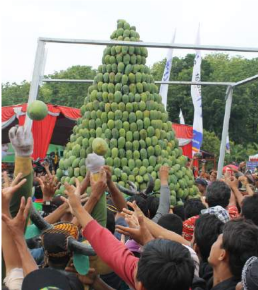
Festival Mangga Istana