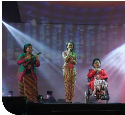
Solo Keroncong Festival