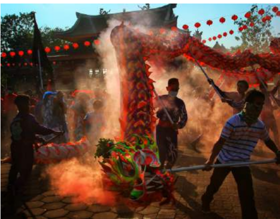
Festival Arak-Arakan Cheng Ho