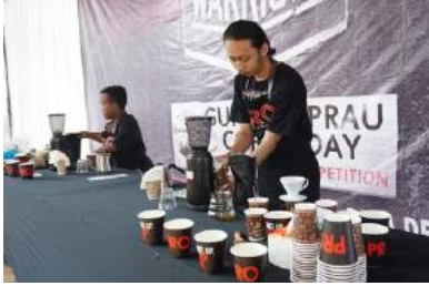
Gunung Prau Coffee Day