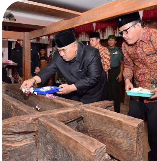
Festival Pulung Langse