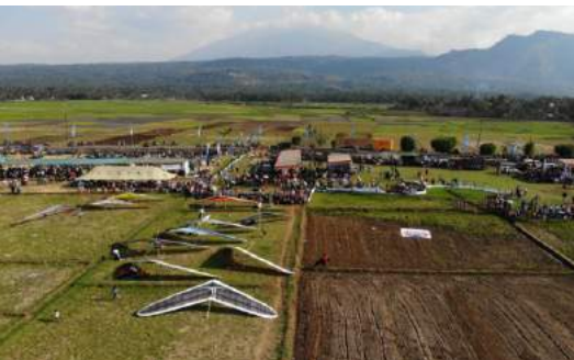
Telomoyo Aerosport Show & Festival

Event tahunan yang menyuguhkan pagelaran seni dari grup-grup kesenian yang ada di sekitar Bukit Cinta Rawa Pening dan pameran UMKM. Acara ini berlangsung beramaan dengan Telomoyo Aerosport Show & Festival.