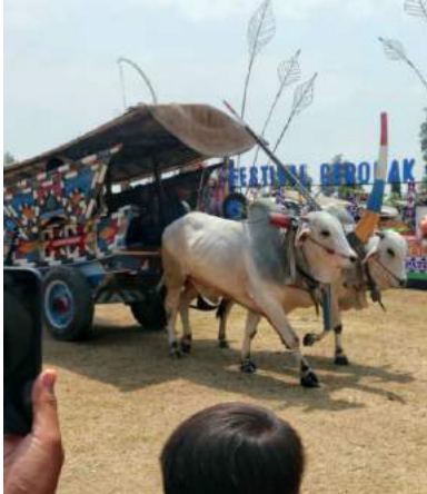
Festival Gerobak Sapi