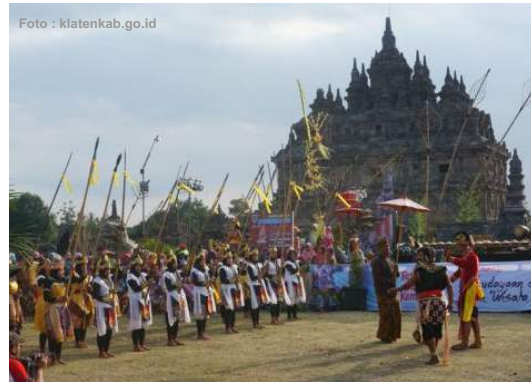
Festival Candi Kembar

Ruwatan PAI dilakukan oleh warga sebagai ungkapan rasa syukur dan tolak bala. Berdasarkan tinjauan sosiologis, ruwatan merupakan upacara spiritual yang bertujuan untuk melenyapkan segala jenis sengkala (kesialan) maupun energi negatif yang menyelubungi diri seseorang atau bisa saja suatu tempat dan barang. Dalam acara ruwatan dimeriahkan grup balo-balo, tari-tarian, barongsai, drum band dan wayang kulit.